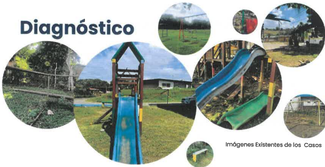
Imágenes Existentes de los Casos

Los parques que serán objeto de intervención son los que están bajo la administración de la Junta Comunal de Chilibre , quienes han identificado la necesidad de mejorar estos espacios para el beneficio de toda la comunidad.